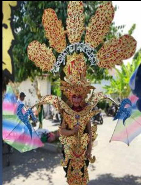
COSTUME ICON PARIWISATA