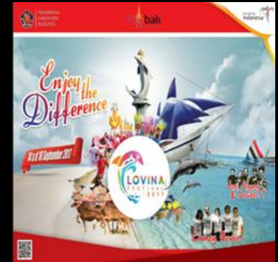
6 th Lovina Fest 2017 Enjoy The Difference