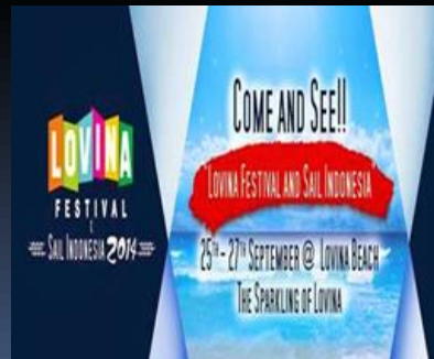
3 rd Lovina Fest 2014 The Sparkling of Lovina