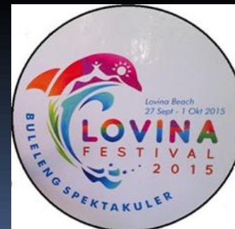
4 th Lovina Fest 2015 Buleleng Spektakuler