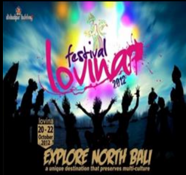
1 st Lovina Fest 2012 Explore North Bali