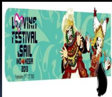
2 nd Lovina Fest 2013