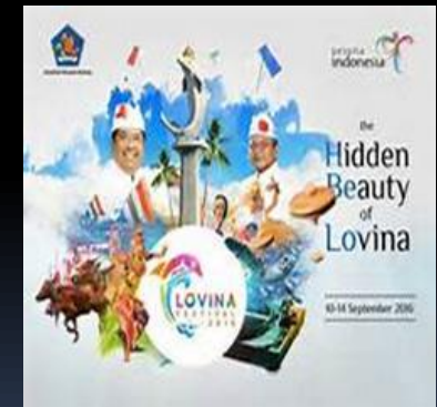
5 th Lovina Fest 2016 The Hidden Beauty of Lovina