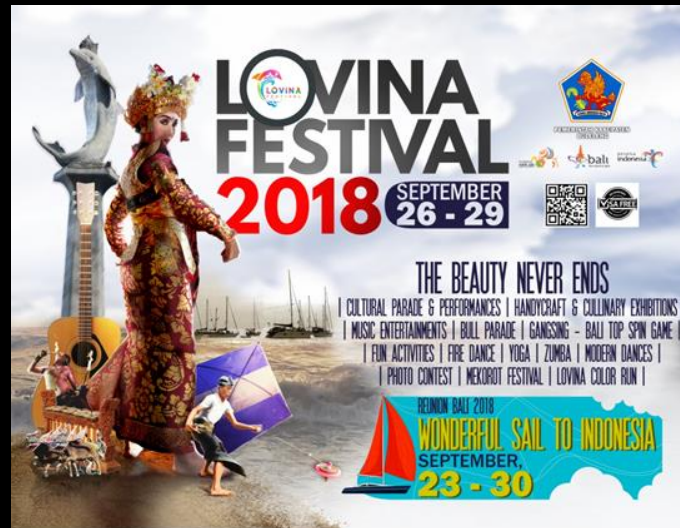
7 th Lovina Fest 2018 The Beauty Never Ends