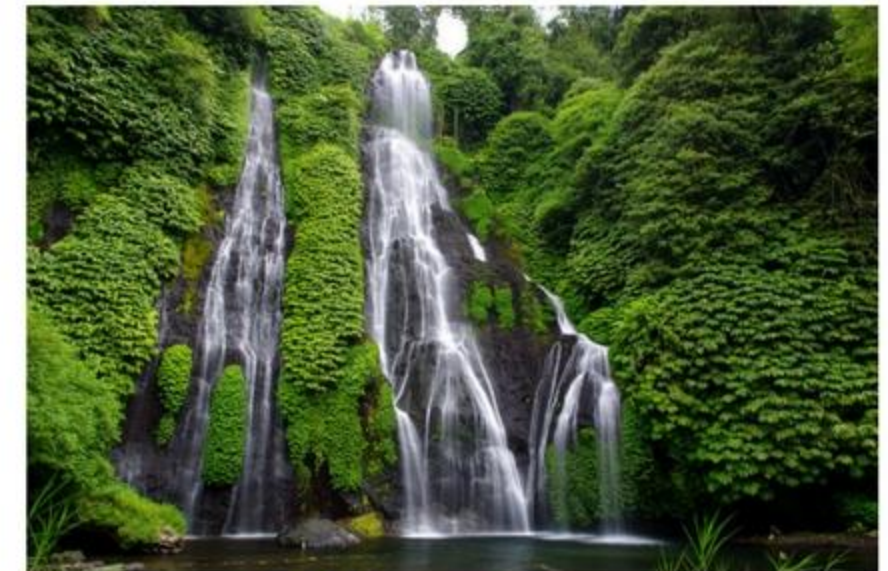
Wisata Air Terjun