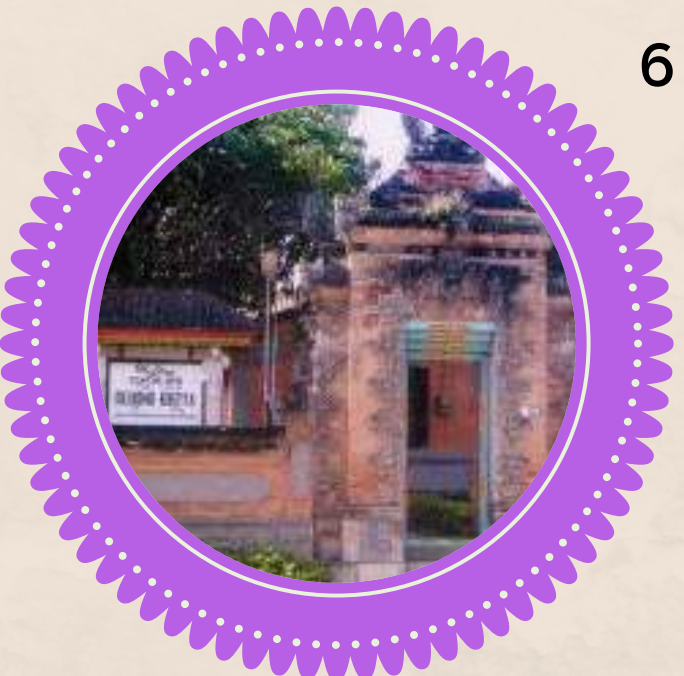
6. GEDONG KIRTYA