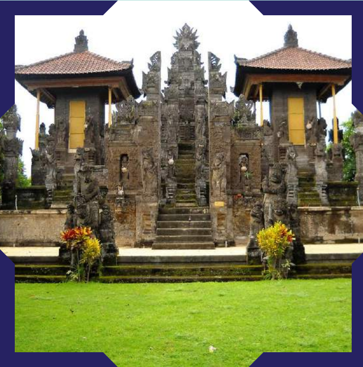
1. Pura Meduwe Karang Kubutambahan - Buleleng