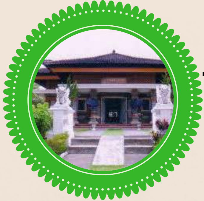
7. MUSEUM BULELENG