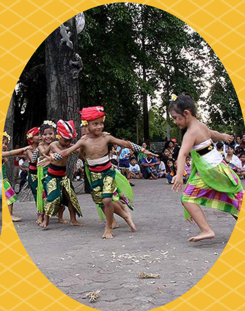
2. MEGUWAK GUWAKAN