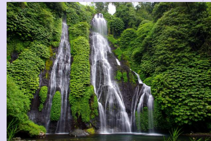
Wisata Air Terjun

ENJOY THE DIFFERENCE AT BULELENG REGENCY