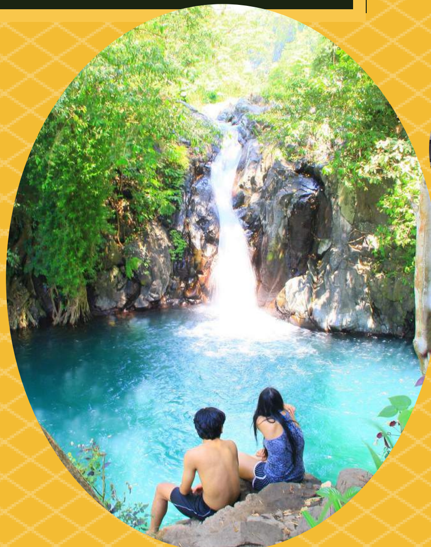
3. AIR TERJUN ALING - ALING