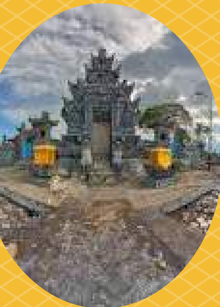
1. PURA PENIMBANGAN