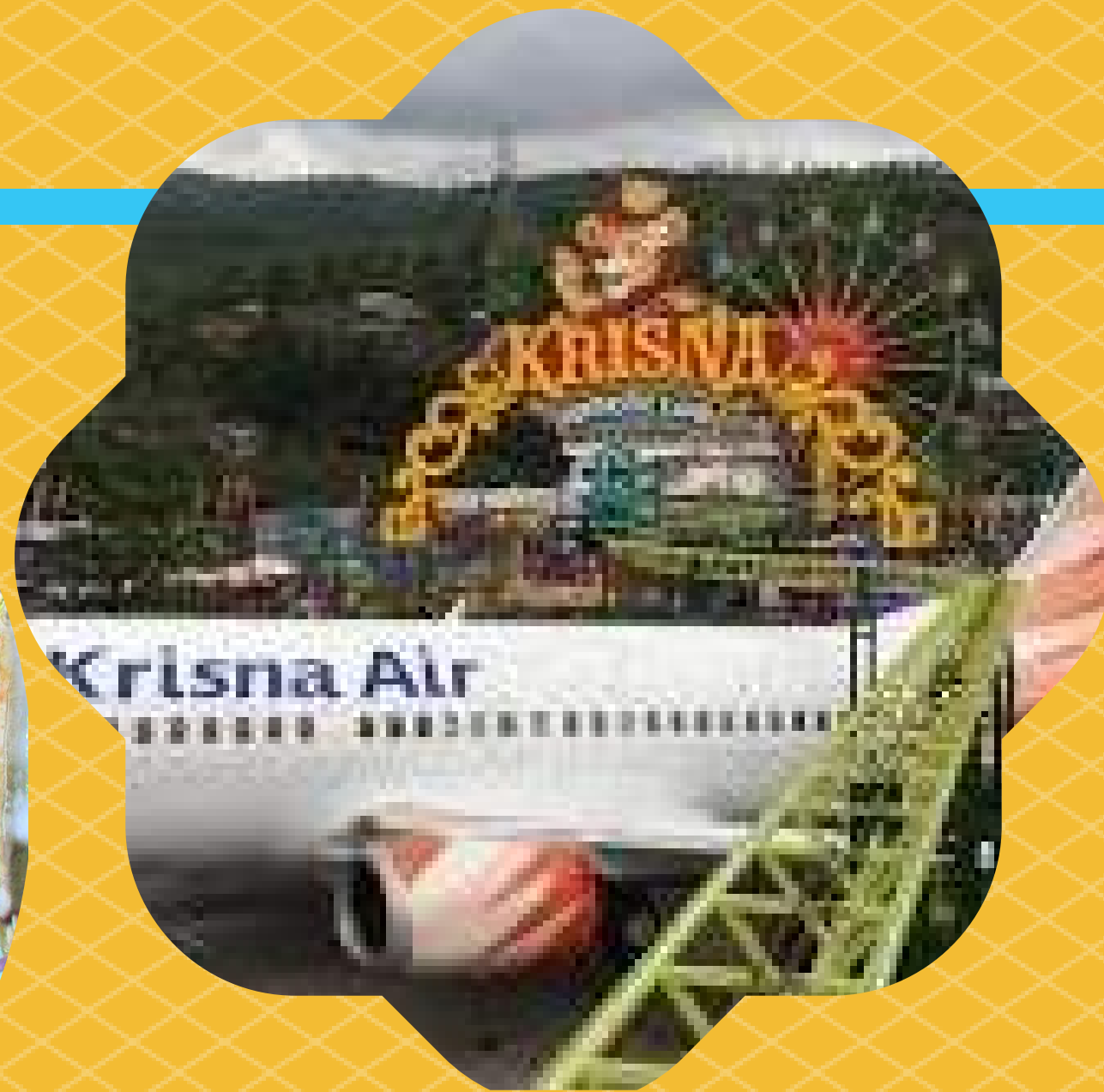
4. KRISNA ADVENTURE