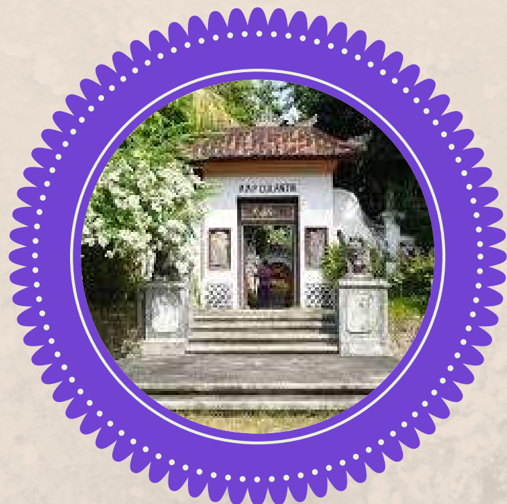
5. PURI AGUNG BULELENG