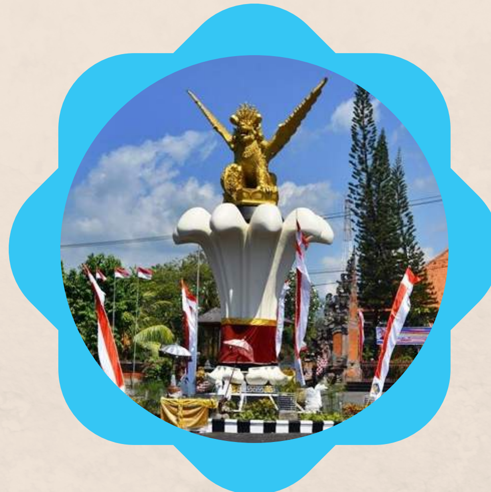
8. TUGU SINGA AMBARAJA