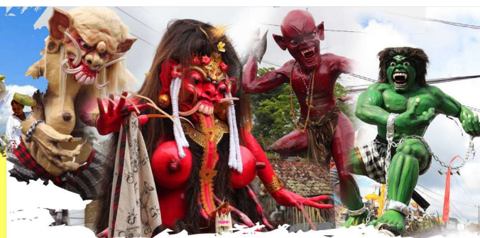
Ogoh - Ogoh

Singaraja City Anniversary is the one of event that is handled to celebrate the Singaraja City anniversary on March 30th. It is celebrated each year in the city. Besides, any kind of activities are performed to improve our nationalism and also there are some culture and art parade that will be covered in this program.