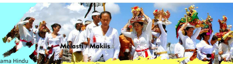
Melasti / Makiis

HUT Kota Singaraja , perayaan hari jadi kota Singaraja ke 415. berbagai kesenian khas buleleng, berbagai lomba dan kegiatan yang semarak akan digelar pada hari ini.